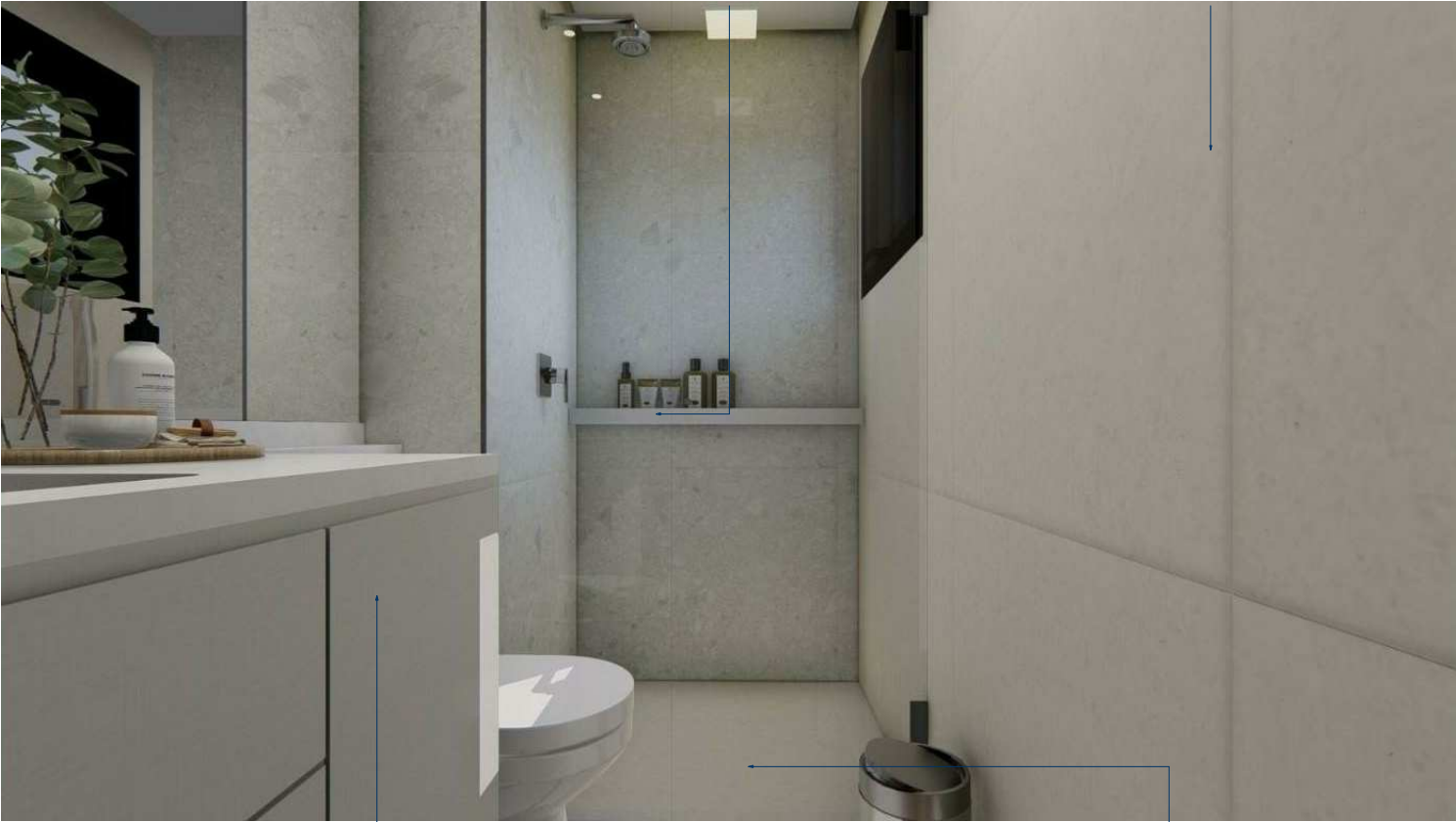
ARMÁRIO BAIXO COM REVESTIMENTO INTERNO EM MDF BRANCO TX E EXTERNO EM MDF 18MM BEIGE - ARAUCO - PORTA DE GIRO COM AMORTECEDOR E GAVETAS COM TRILHO INVISIVEL, PUXADOR CAVA