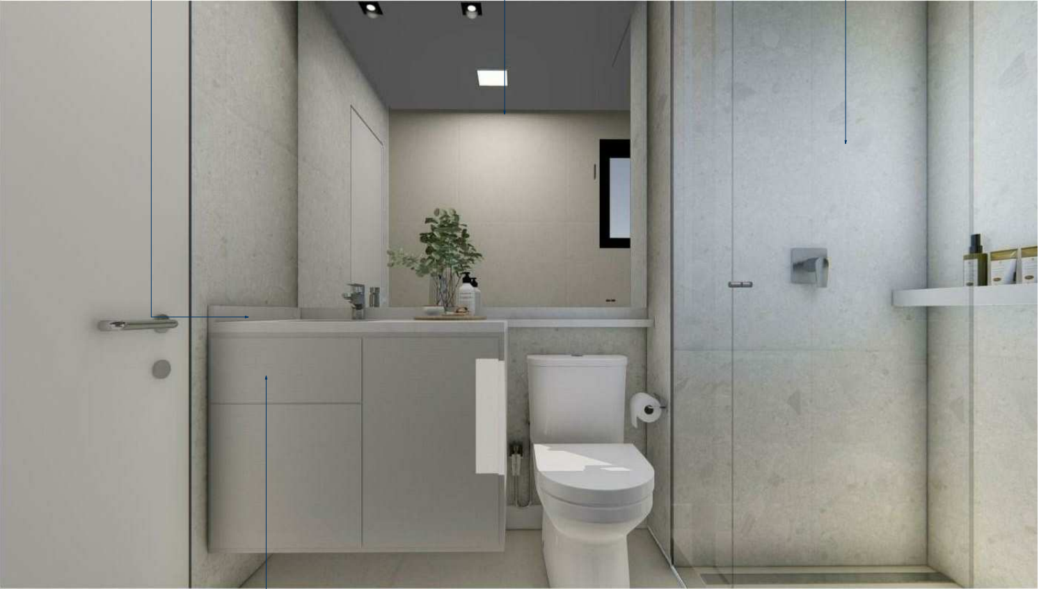
ARMÁRIO BAIXO COM REVESTIMENTO INTERNO EM MDF BRANCO TX E EXTERNO EM MDF 18MM BEIGE - ARAUCO - PORTA DE GIRO COM AMORTECEDOR E GAVETAS COM TRILHO INVISIVEL, PUXADOR CAVA