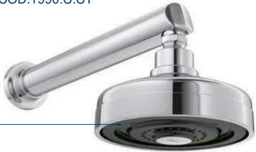
CHUVEIRO COM TUBO RETO DE PAREDE - LINHA ACQUA PLUS - COR: CROMADO - DECA Cód.1990.C.CT